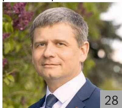
А. Е. КЛИМОВ, министр финансов Тульской области