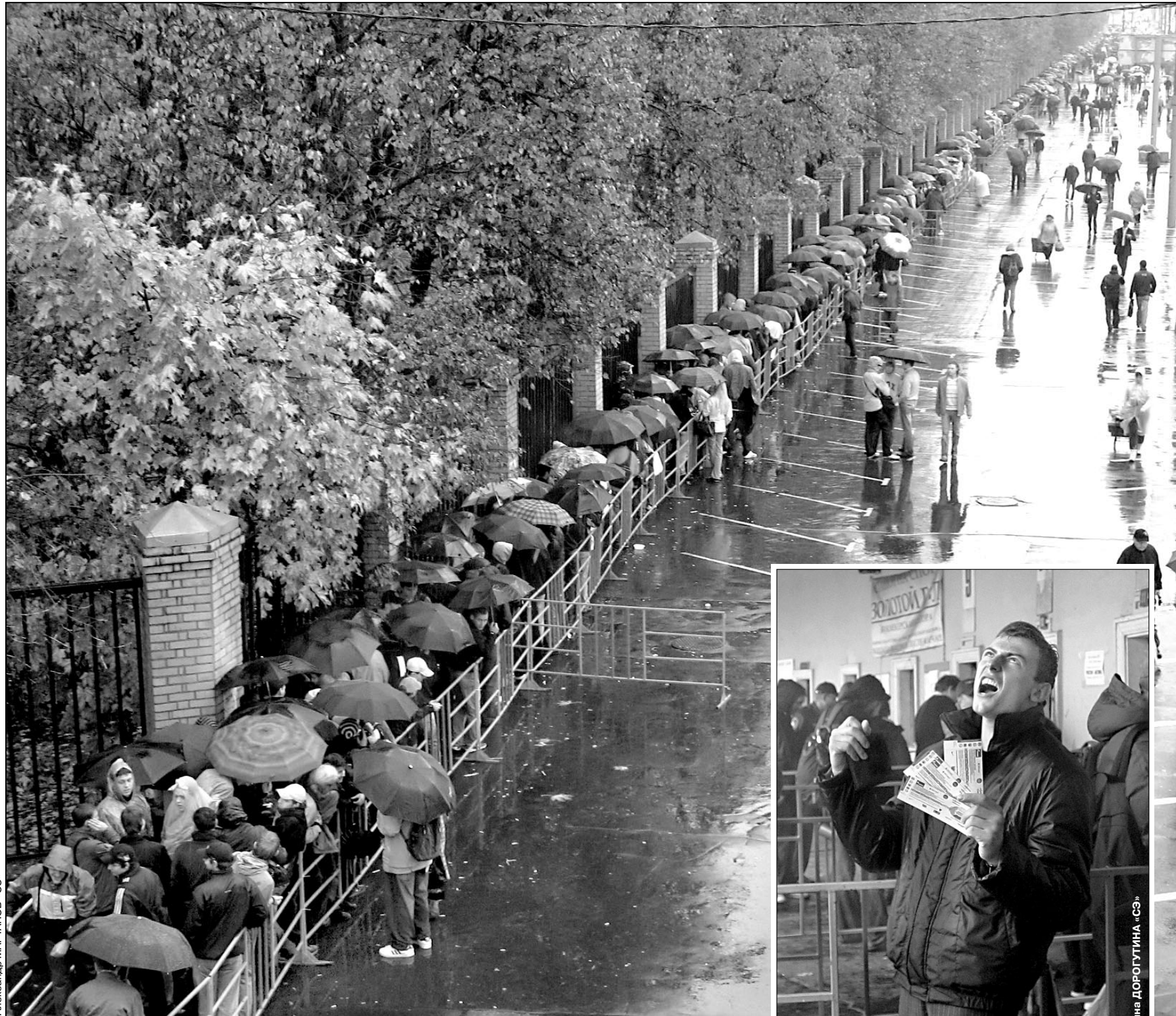
Вчера. Москва. Новолужнецкий проезд. Вид с метрополитана. И это еще не вся очередь...