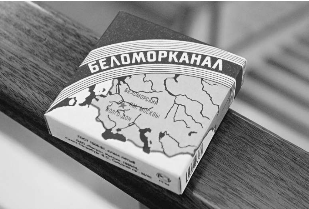
Предприниматель из Уфы хочет монополизировать права на главные папиросы Советского Союза