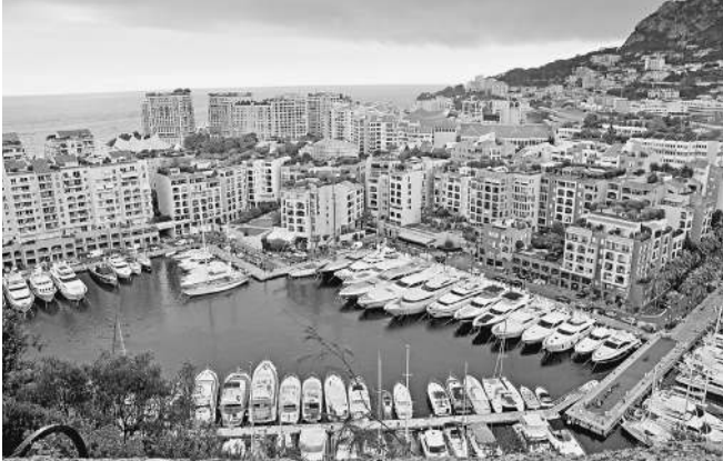
Монако — одно из главных мест в Европе, где умеют прятать и тратить деньги