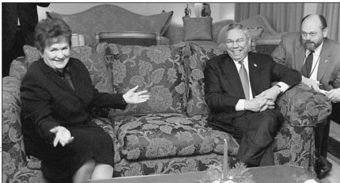
Вице-спикер Госдумы Любовь Слиска встретилась с Колином Пауэллом еще до президента

Через месяц после переговоров Путина и Буша в Техасе дипломаты приступили к подготовке следующей встречи — в середине будущего года Джордж Буш собирается приехать с визитом в Россию.