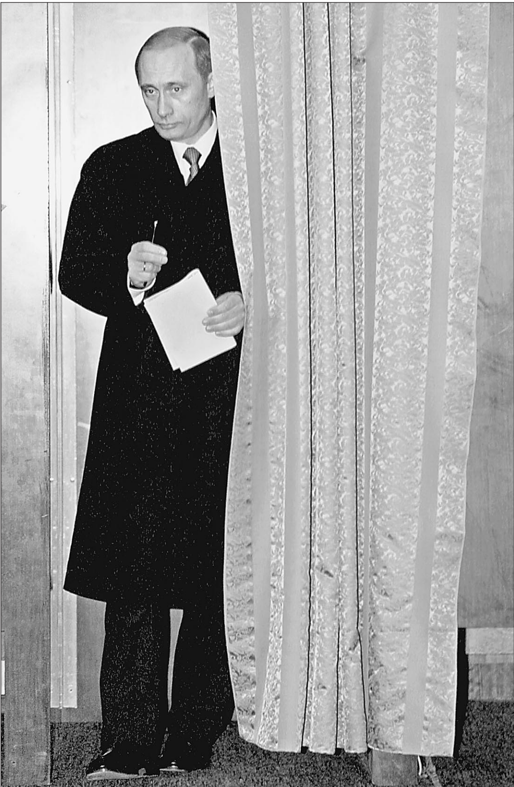
Желание президента — закон