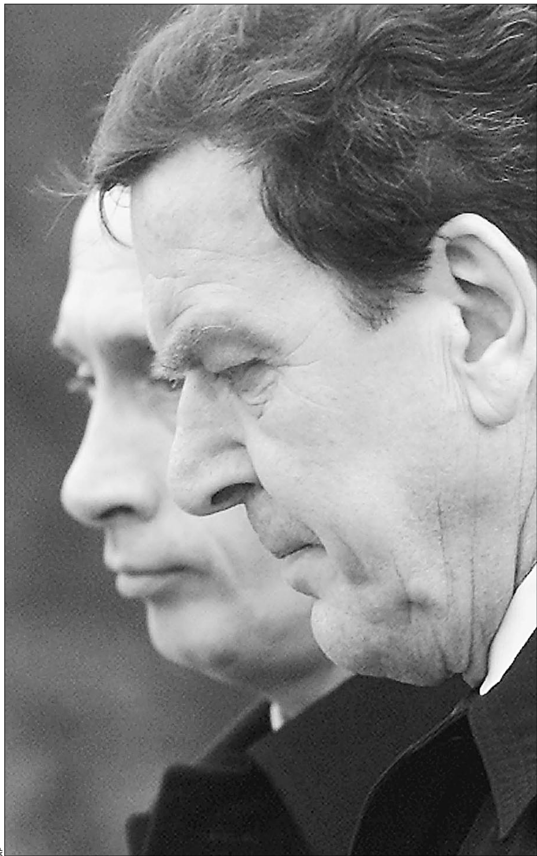
Суровый профиль российско-германских отношений

В этой связи пока не очень понятно, о чем будет говорить премьер Михаил Касьянов со Шредером 25 апреля. На этот день намечена их встреча в Германии, где как раз должны обсуждаться детали и механизмы долговой схемы.