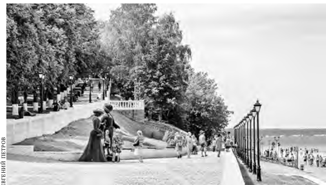
Московская набережная после обустройства стала излюбленным местом прогулок горожан.