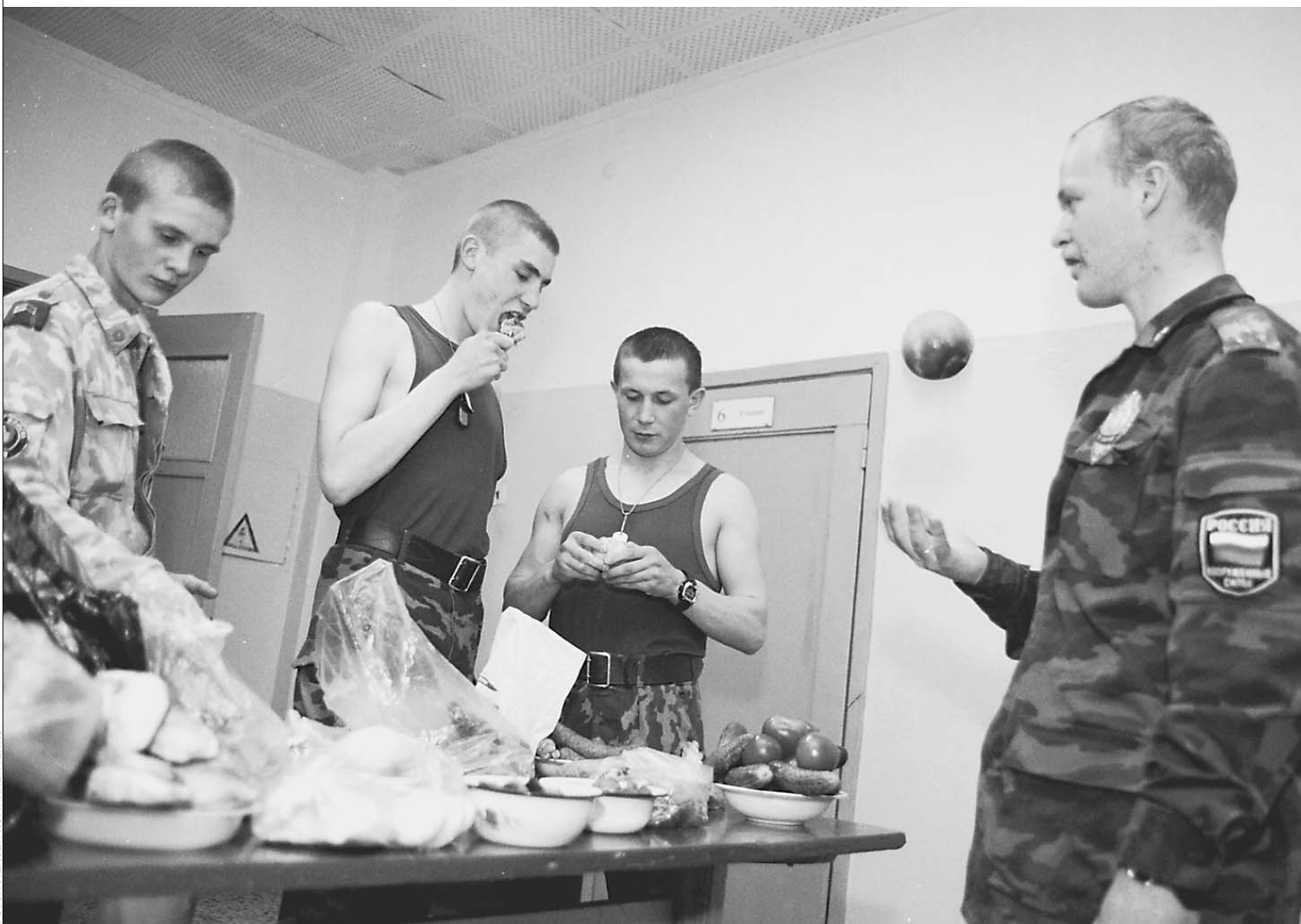
Солдатское «меню» усилят фруктами и овощами

Мясные продукты от поставщика Кремля — «Микояна», шоколад самого высокого качества фабрики имени Бабаева, столовые приборы и посуда из нержавеющей стали, а к этому всему — «шведский стол» из нескольких блюд. Министерство обороны с этого года резко меняет систему обеспечения военнослужащих питанием и их рационы.