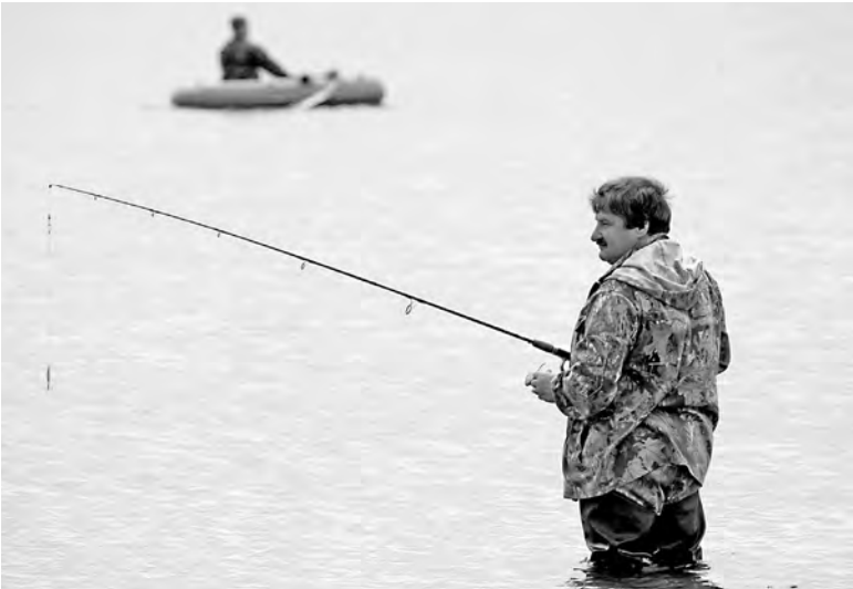
Ловить горбушу разрешат спиннингом или удочкой и только на морском побережье.