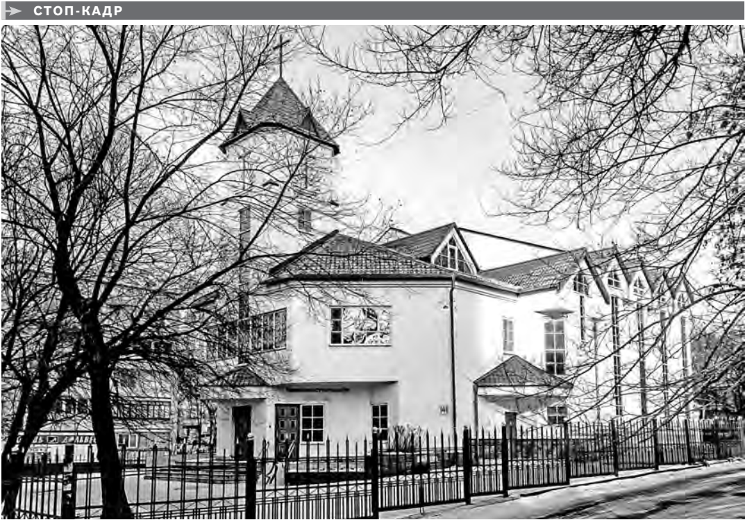
В бывшую Новоапостольскую церковь, которая находится в центре Хабаровске на улице Калинина, переедет краевой театр кукол. Выкупить здание у собственника и передать его министерству культуры решил губернатор региона Сергей Фургал. Об этом сообщил на своей странице в Twitter глава ведомства.

РЕГИОН стал одним из пилотных субъектов РФ, где будет реализована система долговременного ухода. Это комплексная программа поддержки граждан пожилого возраста и инвалидов, частично или полностью утративших способность самообслуживания. Сегодня в Камчатском крае проживает более 62 тысяч стариков. В 2019 году из федерального бюджета на реализацию программы выделено 17 миллионов рублей.