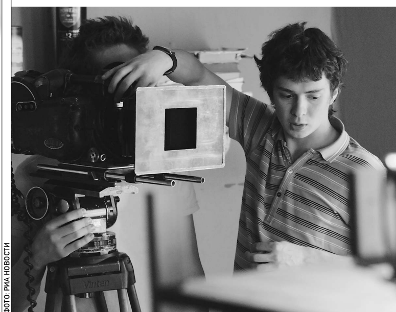
Студентам ВГИКА обещают новые кинокамеры

правил приема. Были у вас проблемы, связанные с ЕГЭ? о: Проблемы были. Во-первых, нам не разрешили организовать предварительные конкурсы, как это делалось раньше. Когда уже на этапе собеседования кто-то мог понять, что лучше отнести документы в другой вуз. → стр. 5