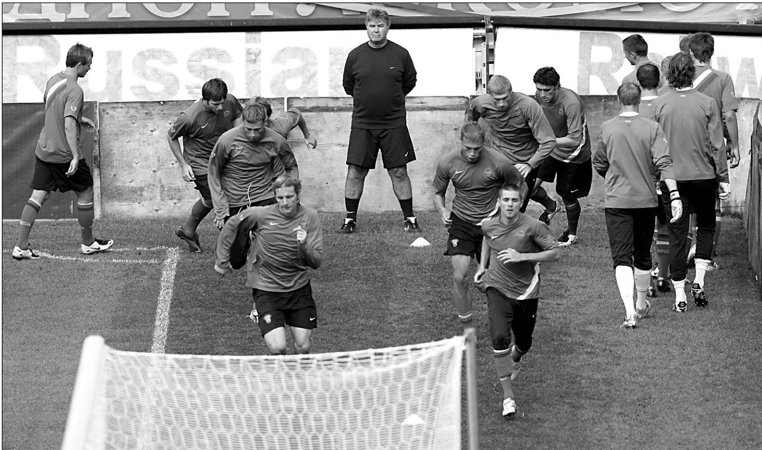
Вчера. Москва. Черкизово. Тренировка сборной России. Гус ХИДДИНК и его команда.

Еще одна задача, которую, похоже, поставил перед собой Хиддинк: не допустить атмосферы