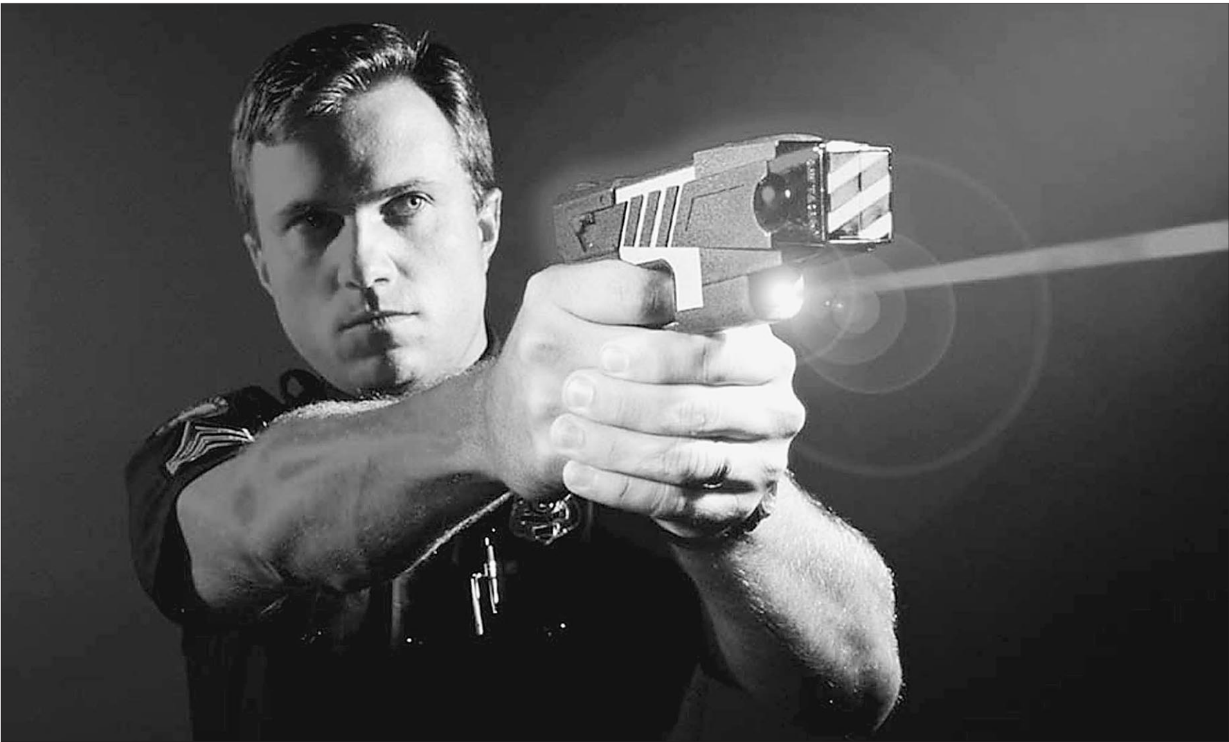
Вижу цель (сотрудник службы безопасности Великобритании с электрошоковым пистолетом)

Впрочем, американцы не торопятся предъявлять миру доказательства вины боевиков «Аль-Каиды». Их понять можно: если «удар возмездия» не будет нанесен и после официального заявления о виновности бен Ладена, битву с терроризмом можно считать проигранной. Не в военном, но в психологическом плане. Безнаказанность террористов