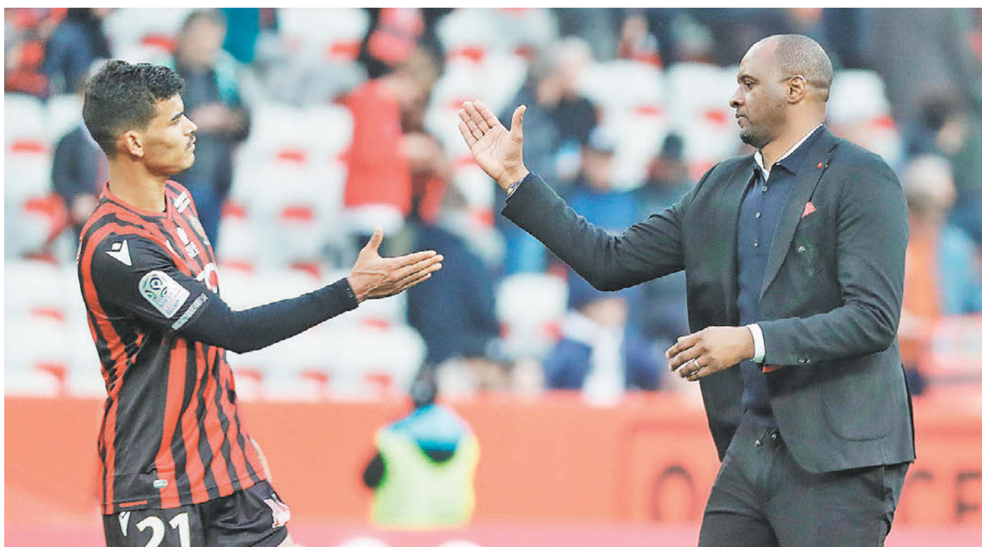
Потенциальный новичок ЦСКА Данило с бывшим главным тренером «Ниццы» Патрикком Виейрой