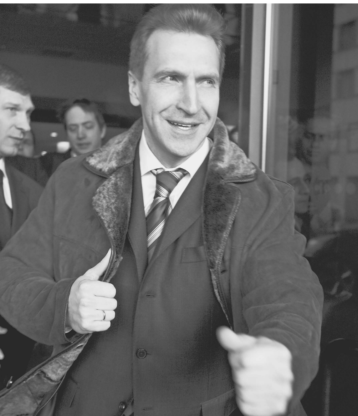
Игорь Шувалов: теперь во многом придется себя ограничивать

Как будет экономить государство, рассказал вчера первый вице-премьер Игорь Шувалов