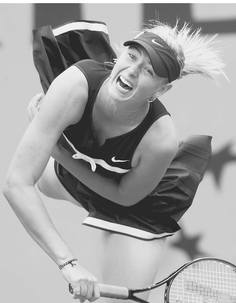
Следующий матч Мария сможет провести не скоро

Долгожданное возвращение Марии Шараповой в большой теннис после воспаления плечевого сустава (так называемого бурсита) снова откладывается. В январе она отказалась защищать свой титул чемпионки Australian Open в Мельбурне, но подарила болельщикам надежду на то, что сможет выйти на корт в следующем месяце. Однако вчера пресс-служба Женской теннисной ассоциации сообщила, что Шарапова не будет участвовать в февральских турнирах WTA в Париже и Дубае. «Известия» попытались разобраться в причинах полугодового отлучения от тенниса бывшей первой ракетки мира.