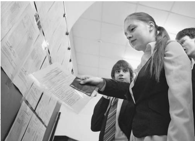
Опыт предыдущих поколений экзаменуемым не поможет