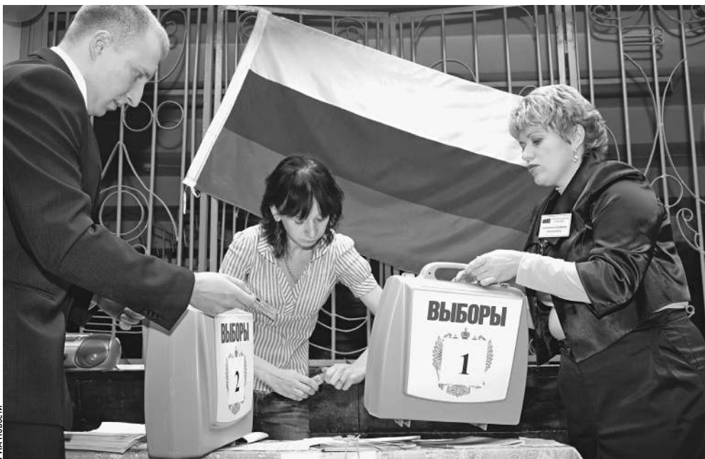
Переносные урны должны были облегчить процесс волеизъявления инвалидам и престарелым