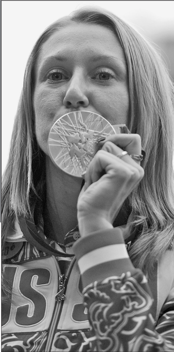
7 августа 2012 года. Лондон. Юлия ЗАРИПОВА с золотой олимпийской медалью.