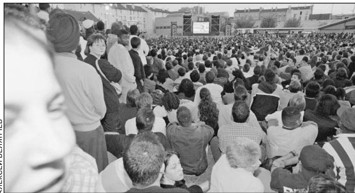
Не помогут и уличные телевизоры

Россияне могут не увидеть футбольный чемпионат мира 2002 года