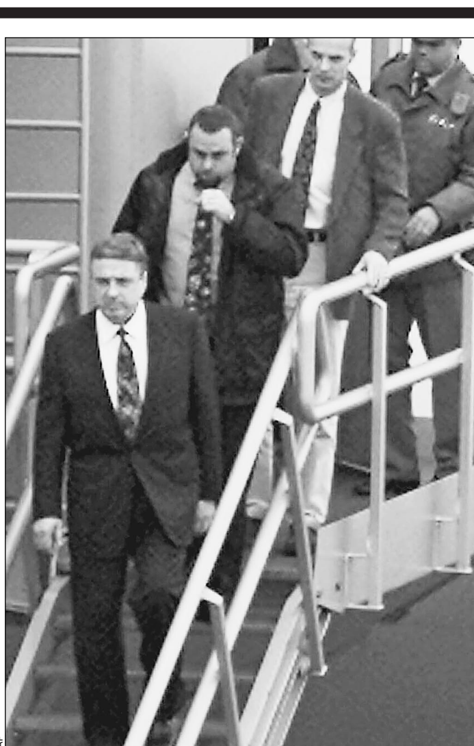
В Швейцарию — за свободой