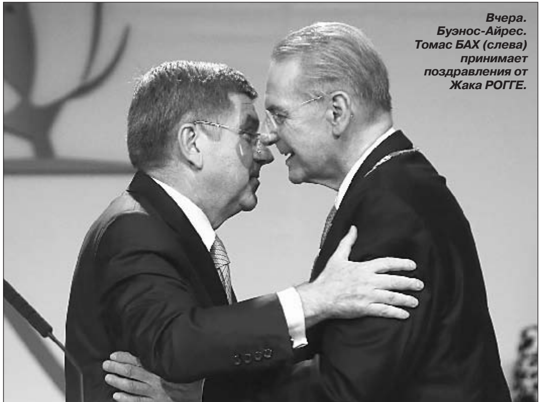
Вчера. Буэнос-Айрес. Томас БАХ (слева) принимает поздравления от Жака РОГГЕ.

пелло всех поздравил, но сказал, что так играть на последних минутах нельзя - Капелло снова был страшен в гневе? - На этот раз чуть помягче. Ха-ха. - Что скажете о поддержке питерской публики? - Полный стадион собрался. Это ж хорошо! - Хотелось бы почаще бывать в Петербурге? - Так я не отсюда родом. Может, попробую в Белгороде сыграть? Приглашаю. - На «Петровском» было лучше, чем в Казани? - Когда играешь за сборную, всегда много народу приходит. Поэтому сравнивать тяжело.