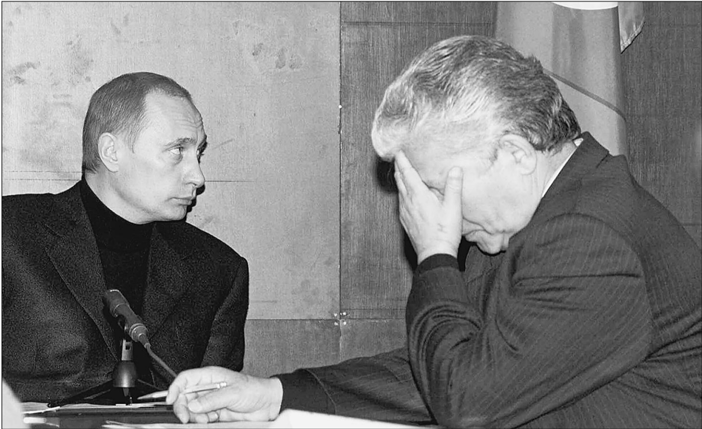
Президент Якутии Михаил Николаев кается