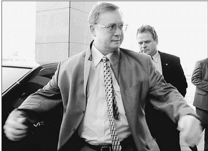
Председатель Счетной палаты Сергей Степашин обвиняет

Вчера глава Счетной палаты Сергей Степашин заявил, что ответственность за нецелевое использование средств, выделенных на восстановление Ленска, лежит на руководстве Якутии. Хотя деньги на восстановление затопленного города распределяли отнюдь не только якутские власти, а акт сдачи города подписывал глава правительственной комиссии — министр по чрезвычайным ситуациям и руководитель новой партии власти Сергей Шойгу. После того, как в минувшие выходные были уволены 14 офицеров Северного флота, но свой пост сохранил главноком ВМФ, можно говорить, что в России появляется новый способ наказания чиновников. «Первых лиц» не наказывают. Наказывают «вторых». «Известиям» удалось документально доказать, что якутские власти были назначены «крайними» заранее.