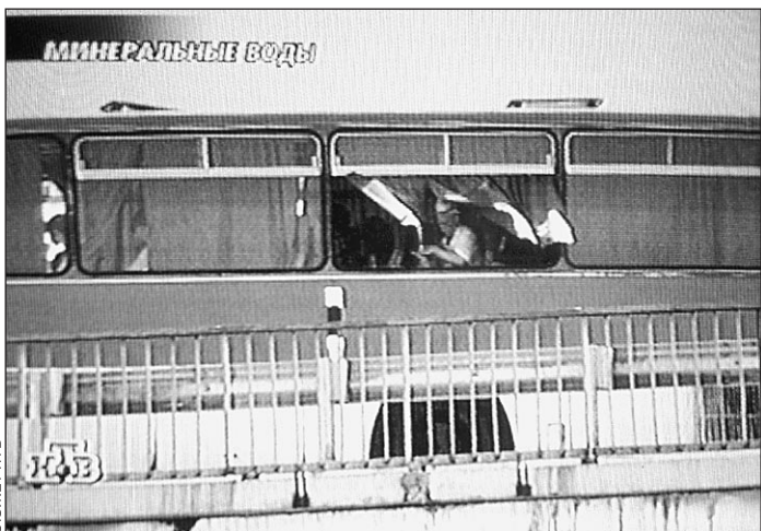
Минеральные Воды. Год 2001-й

Очередные террористы захватили очередной «Икарус»