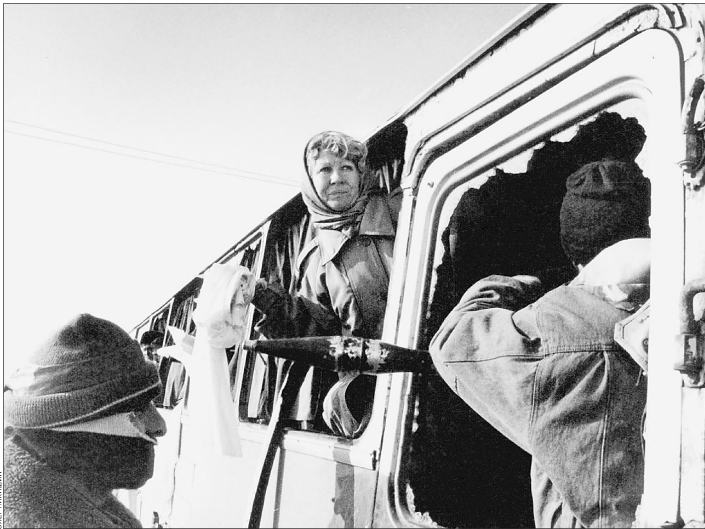
Буденновск. Год 1996-й

Около 15 часов террористы потребовали передать им шесть автоматов Калашникова и боеприпасы. Очередное требование террористов наконец внесло ясность в вопрос, всю первую половину дня остававшийся без ответа. Требование предоставить шесть автоматов Калашникова позволяло сделать вывод: преступников в автобусе по крайней мере семеро. Ранее сообщалось, что захватили автобус на автовокзале Невинномыска два террориста, один из которых был во-