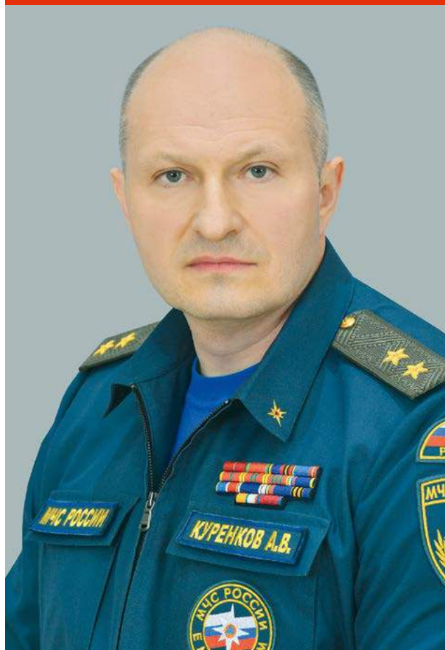
АЛЕКСАНДР КУРЕНКОВ, министр Российской Федерации по делам гражданской обороны, чрезвычайным ситуациям и ликвидации последствий стихийных бедствий