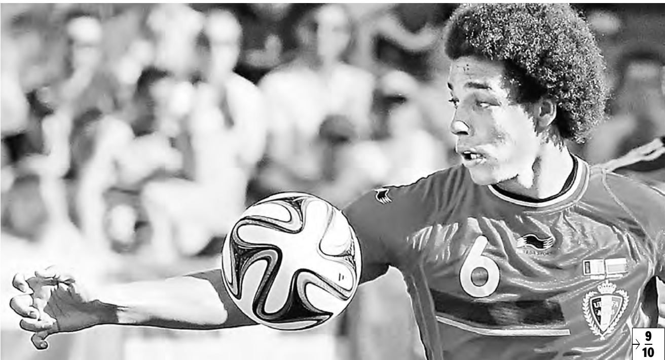
Полузащитник питерского «Зенита» Аксель Витсель помог сборной Бельгии добраться до четвертьфинала чемпионата мира.

Деловой завтрак Сегодня стартует новая программа жилищного строительства