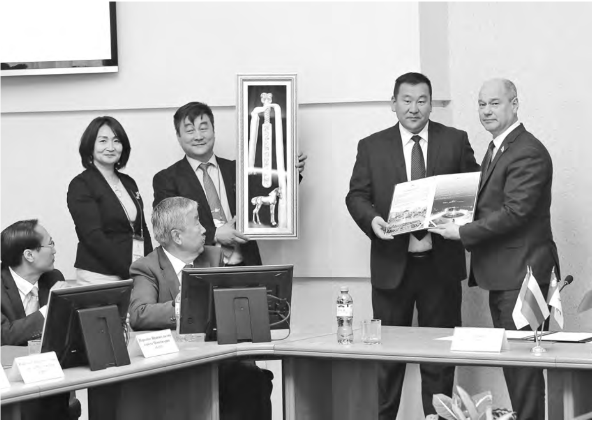
УПРАВЛЕНИЕ ПО ИНФОРМАЦИОННОЙ ПОЛИТИКЕ УЛАН-УДЭ

Например, Уланчаб и Улан-Удэ договорились организовать прямое международное пассажирское