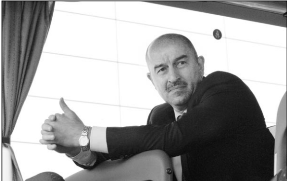
Вчера. Аэропорт Глазго. Станислав ЧЕРЧЕСОВ.

Матч «Селтик» - «Хартс» вы наверняка смотрите. И 5:0 - счет внушительный. Очень страшные шотландцы, кто из Глазго?