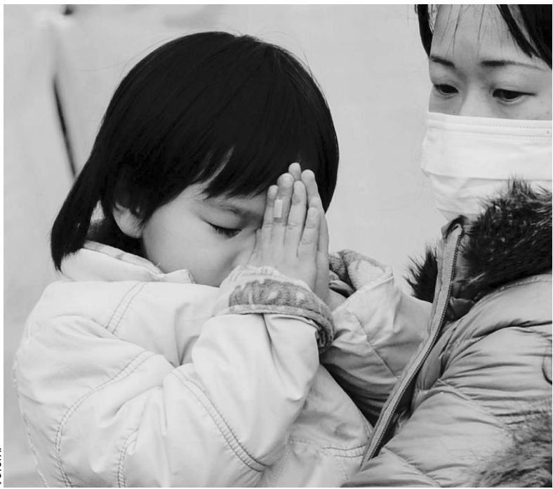
За жертв трагедии в Японии переживают даже дети