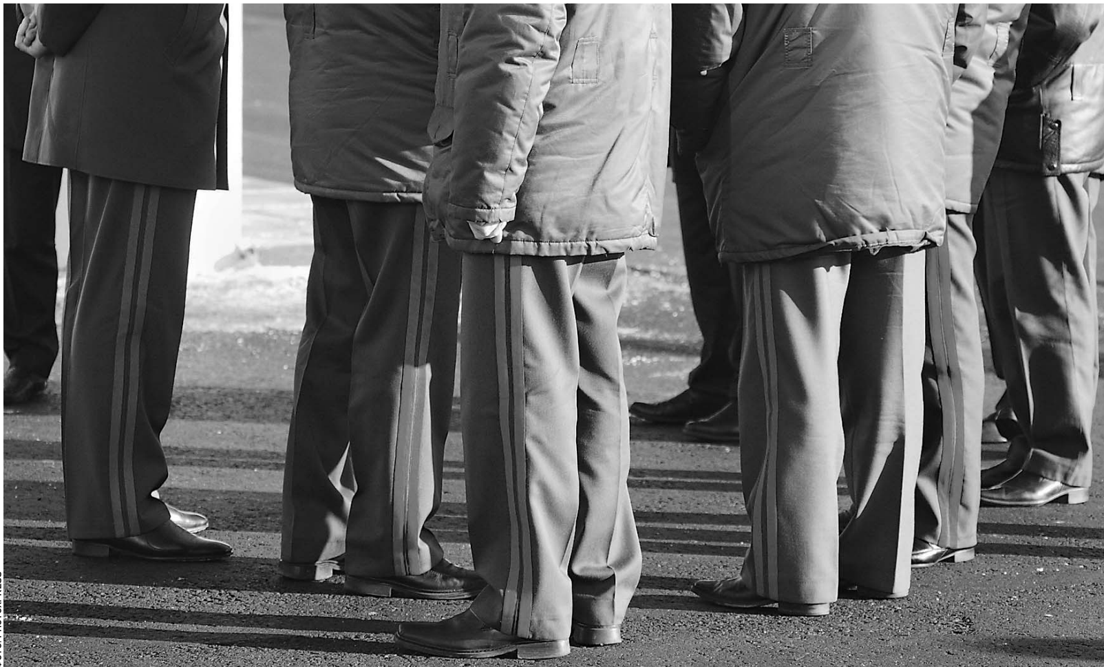
Несколько десятков высокопоставленных сотрудников милиции так и не смогут стать полицейскими. Не пройдут перееаттестацию

Президент решил уволить еще 50 генералов МВД