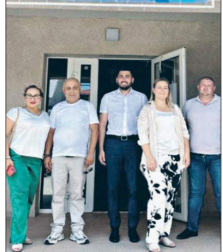
ГАУ «Черноморский биосферный заповедник»

В Херсонской области заповедник, находящийся в прифронтовой зоне, отметил 97-летие со дня своего основания. Несмотря на близость боевых действий, сотрудники Черноморского биосферного заповедника провели тематическую фотовыставку. Представленные на ней фотографии показывают растения и животных на маршрутах заповедника. В руководстве природного комплекса подчеркивают важность продолжения деятельности на новом этапе – в составе России.