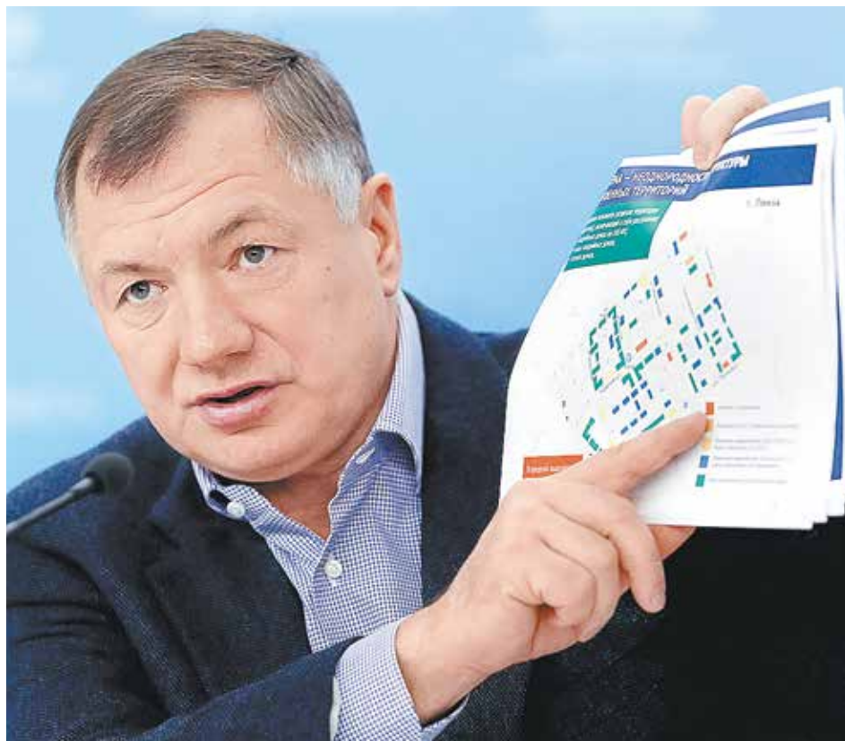
Вице-премьер Марат Хуснуллин на брифинге в Доме правительства РФ

Курс на ускорение жилищного, инфраструктурного и транспортного строительства требует консолидации усилий на всех этапах работы и централизации принятия решений. В связи с этим в августе этого года президент РФ Владимир Путин поручил правительству проработать вопрос укрупнения госзаказчиков в строительстве. Позднее премьер-министр Михаил Мишустин подписал распоряжение о передаче Минстрою России шести дирекций-заказчиков объектов капитального строительства, ранее входивших в состав Минспорта, Минкультуры, Минобрнауки, Минздрава РФ и Федеральной налоговой службы. А в конце прошлой недели правительство РФ внесло в Госдуму законопроект о создании публично-правовой компании «Единый заказчик в сфере строительства». По словам вице-премьера правительства РФ Марата Хуснуллина, принять закон планируется до конца этого года. «Считаем идеальным вариантом, чтобы до конца года закон прошел, если он будет принят, то нам надо еще один-два месяца, чтобы сформировать компанию, — заявил вице-премьер. — Сейчас мы управляем шестью дирекциями, которые переданы Минстрою из других министерств, а после появления закона мы объединим эти дирекции на базе публично-правовой компании и построим реального управленца государственными капитальными вложениями».