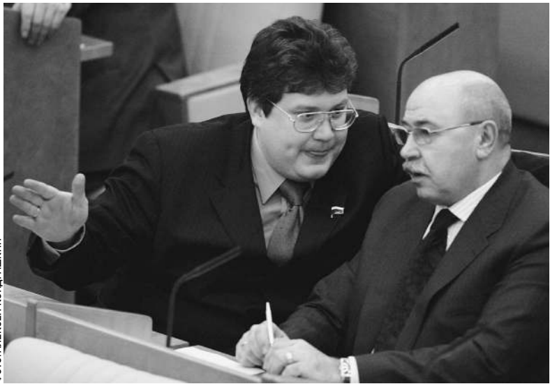
Депутаты Госдумы Алексей Гузанов (слева) и Борис Зубицкий, доход которого в прошлом году составил 1,9 миллиарда рублей