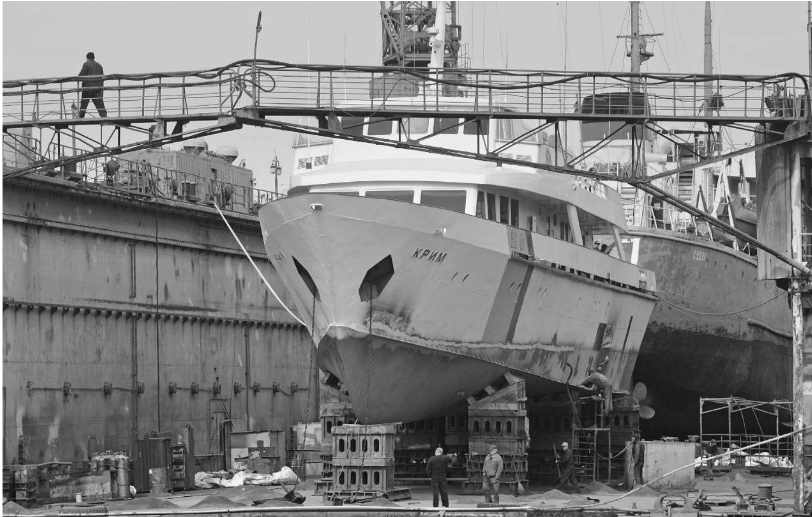
Перед новым морским сезоном яхте «Крым» наводят красоту на судоремонтном заводе «Южный Севастополь»

«Известия» выяснили судьбу уникальной яхты советских руководителей