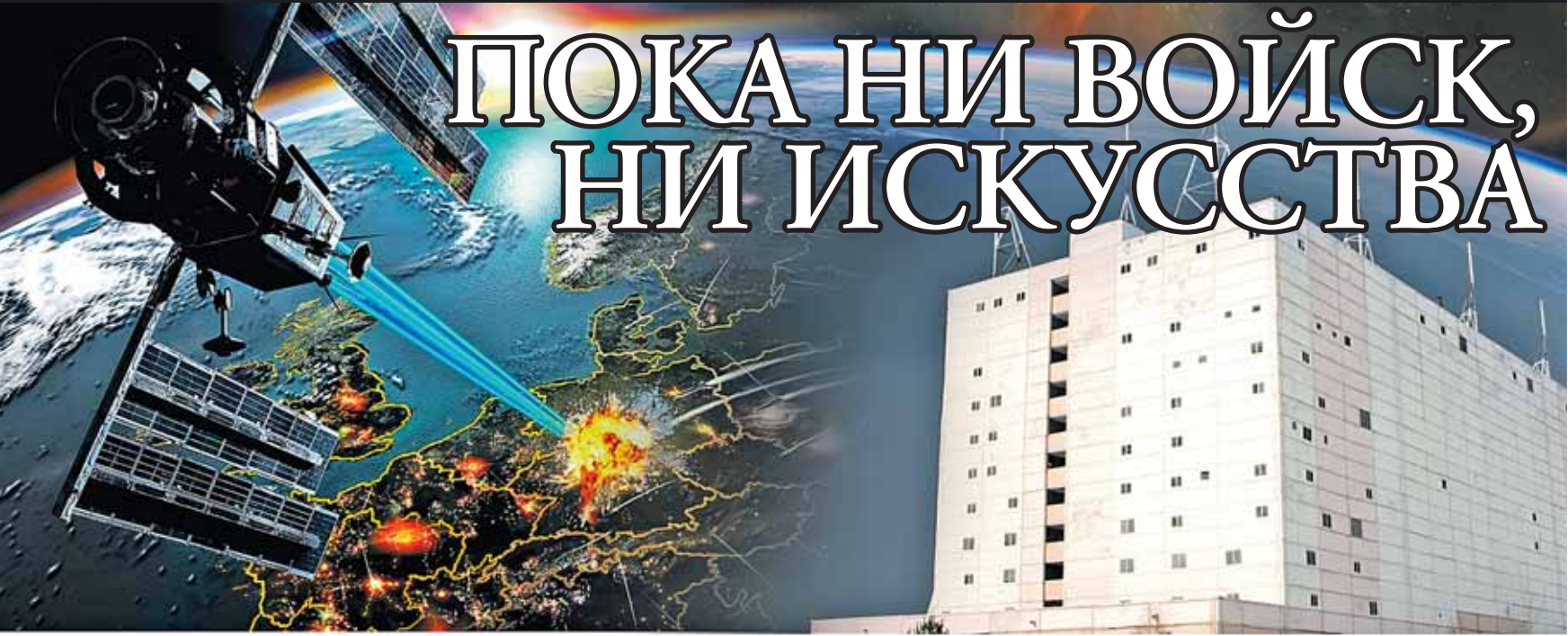
Коллаж: Андрей СЕДУХ

В настоящее время происходит сти-рание границ между стратегическим, оперативным и тактическим уровнями управления. Определяется это тем, что в предположении отсутствия прямой военной опасности и развязывания крупномасштабной войны Вооружен-ные Силы России ориентируются и гото-вят к локальным войнам и вооружен-ным конфликтам. А для них характерно то, что в них решаются государственные стратегические задачи войны, но опера-тивными и даже тактическими группир-овками войск. В этом случае стратеги-ческие органы управления объективно, параллельно со своими стратегически-ми задачами начинают решать задачи оперативного уровня. А порой они просто подменяют его, вмешиваются в решение тактических задач управления – занимаются распределением огня по объектам, распределением целей для поражения и т. д. Это же делает и опера-тивный орган управления. Получается асимметрия: система управления ВС РФ