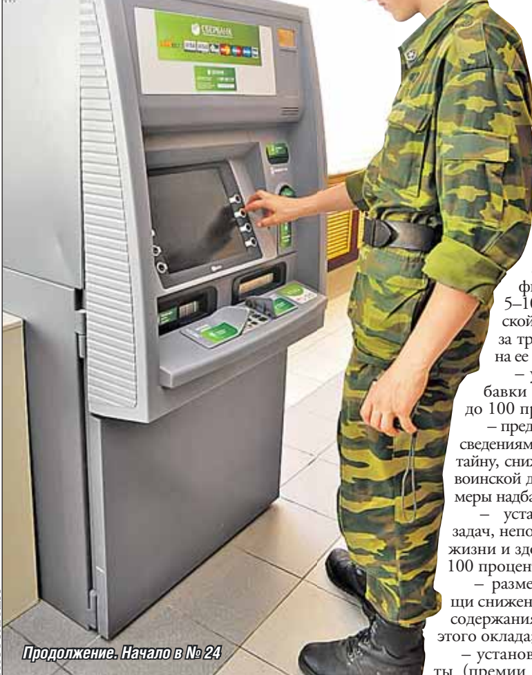
Продолжение. Начало в № 24

А какие объекты обороняют войска (силы) ПВО современных ВС РФ? Это крупные военно-политические, административные и экономические центры. Налицо противоречие между приоритетами воздушной агрессии и противовоздушной обороны. Причем для любого из рассмотренных сценариев начала войны. Но мало того, что российская ПВО (ВКО) обороняет не совсем так, как надо. Она еще и делает это не совсем так, как надо. Что лежит в основе применяемой сейчас логики организации противовоздушной обороны? За основу принимается не ответительная во времени и по задачам противника, а абсолютная и неизменная важность всех объектов, потенциально подверженных удару воздушного противника. Поэтому, в частности, ПВО Москвы всегда оказывается важнее обороны аэродрома, где базируется дальняя авиация, или обороны командного пункта объединения Войск ВКО. Необходимо отойти от позиционных принципов организации ПВО (ВКО) и оборонять приоритетно те объекты, которые определяют содержанием целей и задач каждого очередного МРАУ противника, вне зависимости от их абсолютной (стоимостной, политической, экономической) важности. Это же относится и к обороне точечных объектов (критических элементов) в структуре большого (площадного) объекта.