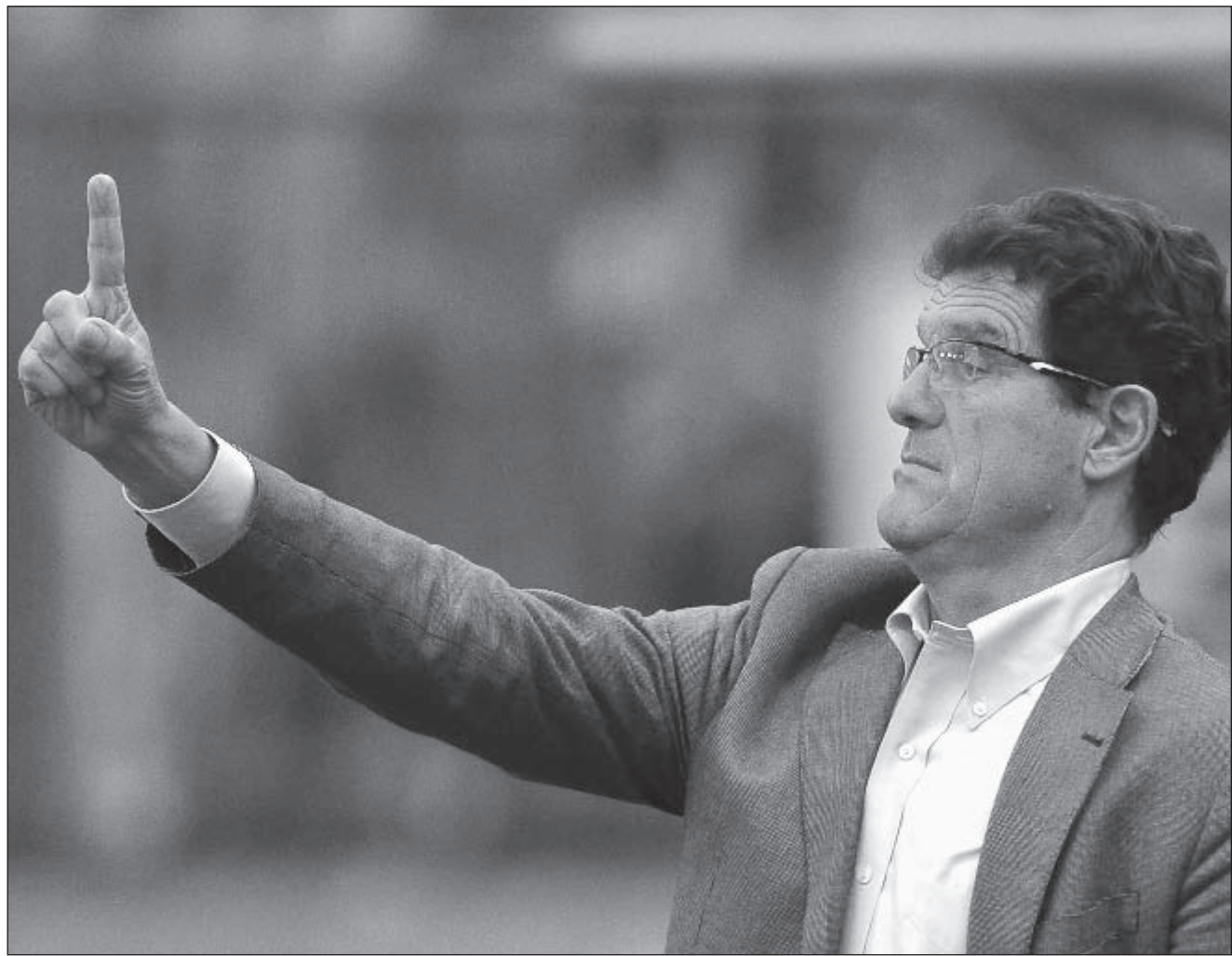
Среда. Москва. Черкизово. Фабио КАПЕЛЛО в России: первый матч, первый гол.

Другие материалы о матче сборной России - стр. 2