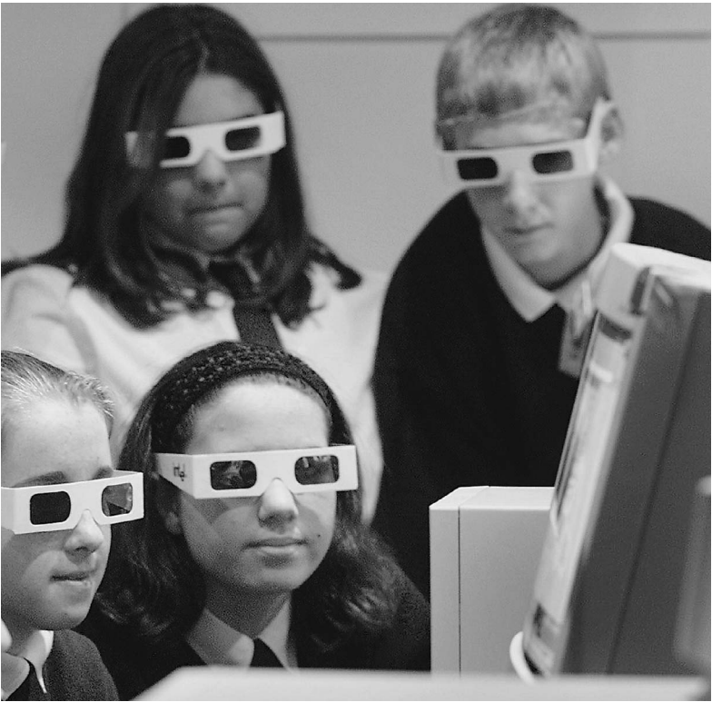
Музейные экспозиции онлайн внесут свой вклад в эстетическое образование юношества