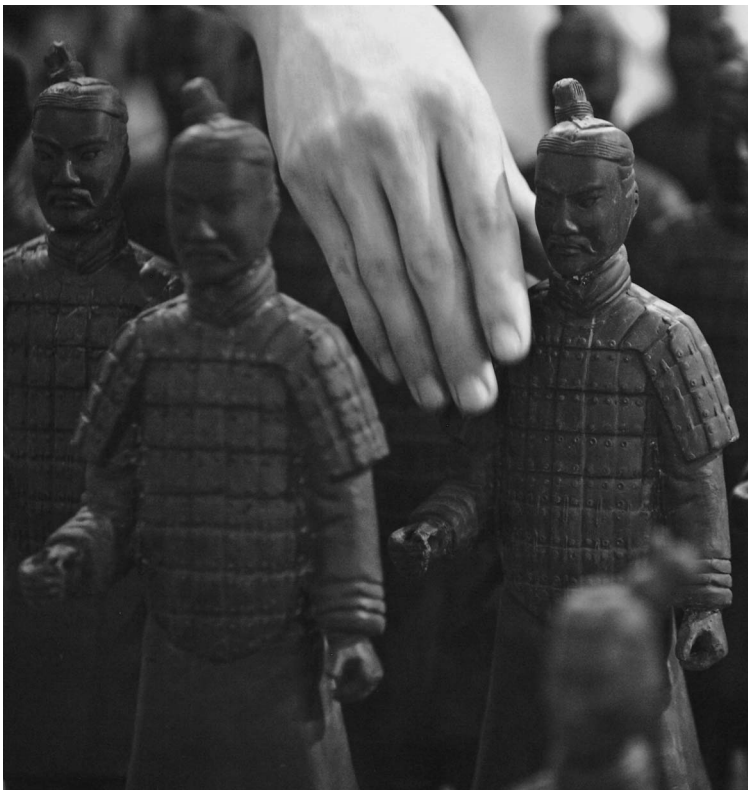
Экономить шоколад не принято: из него создают целые терракотовые армии

Из-за роста цен на какао-бобы и сахар шоколад может стать недоступным для многих удовольствием. Заменой натуральному лакомству станут суррогаты, единственное достоинство которых — дешевизна ➔06