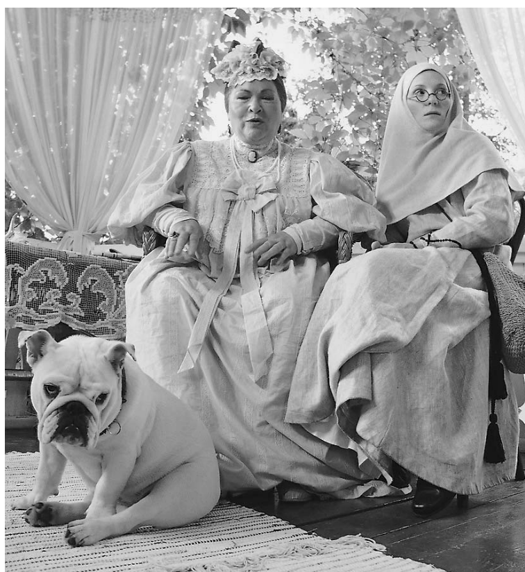
«ПЕЛАГИЯ И БЕЛЫЙ БУЛЬДОГ» — долгожданная премьера по Борису Акунину

О: Скажем так, молодежь менее отзывчива на телевидение. Есть такая тенденция: женщина в районе тридцати лет переходит в группу зрелости 45+. Это не означает, что она внутренне старая. Просто она хочет стабильности. А вот мужчины от 30 до 45 лет присутствуют во всех каналах. Они ищут. → стр. 10