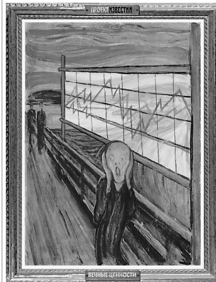
Тарифы растут. Иллюстрация Константина Валова по мотивам картины художника Эдварда Мунка «Крик» (1893 г.)

Хиддинк в Москве нередко опаздывает. Совсем не из стремления подчеркнуть собственную важность, скорее, наоборот — голландцу сложно расставить время в столичных пробках. Но вчера он был предельно пунктуален, ведь к обеду ему уже нужно было вернуться в отель, куда на предыгровой сбор перед матчами с командами Лихтенштейна и Уэльса собирались его футболисты. → стр. 11