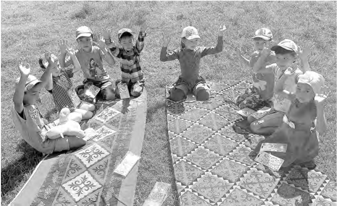
УПРАВЛЕНИЕ СОЦИАЛЬНОЙ ПОДДЕРЖКИ НАСЕЛЕНИЯ КОШ-АГАЧСКОГО РАЙОНА

В Республике Алтай воспитатели приезжают на стоянки чабанов