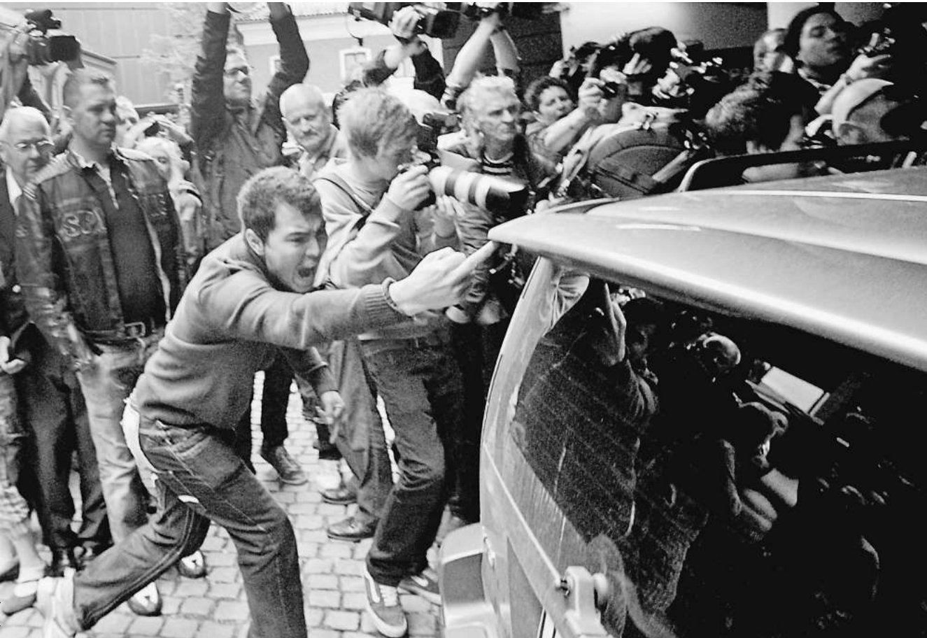
Полицейская машина, перевозившая Андерса Брейвика, подверглась нападению толпы в Осло. «Каждый здесь хотел бы видеть его мертвым», — заявил один из собравшихся