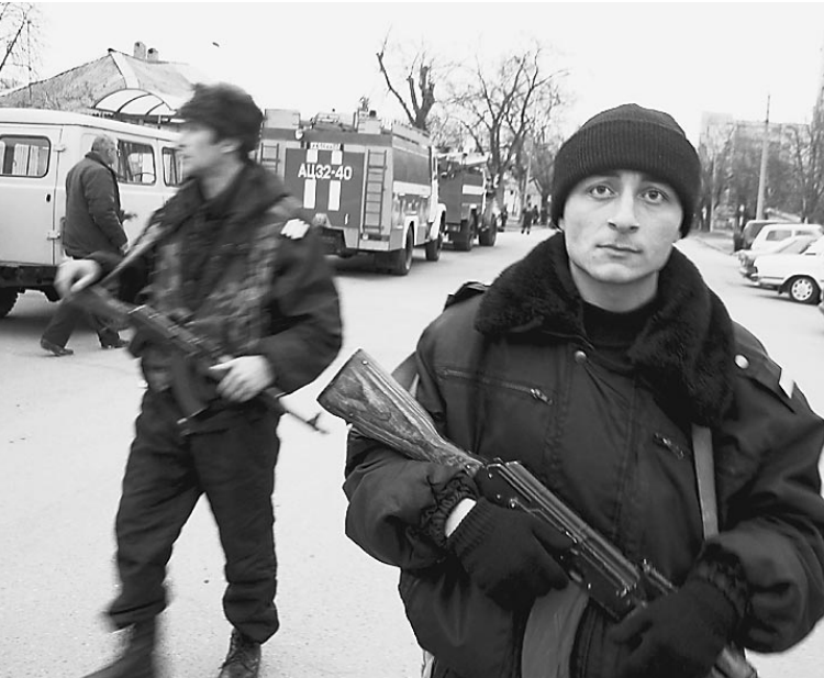
На сей раз при ликвидации боевиков тяжелая техника не применялась — спецподразделения обошлись стрелковым оружием

На вчерашней пресс-конференции в Нальчике руководивший операцией по уничтожению боевиков замминистра внутренних дел России Аркадий Еделев не скрывал удовлетворения. → стр. 2