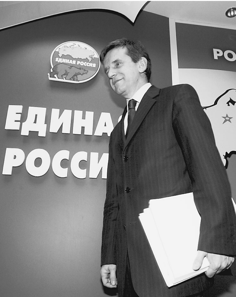
«Единая Россия» пощадила Михаила Зурабова

Он упирал на возросшую точность учета числа льготников — их насчитали чуть больше 15 миллионов — рост денежных доходов граждан: «инвалиды, участники ВОВ получают в среднем 3680 рублей, ветераны войны — примерно 3610 — это довольно заметная прибавка для порядка одного миллиона льготников». Дает одно из объяснений возникших сложностей: «В последние 14 лет проекты такого масштаба не реализовывались. Было задействовано огромное количество участников, которых надо было синхронизировать». → стр. 2