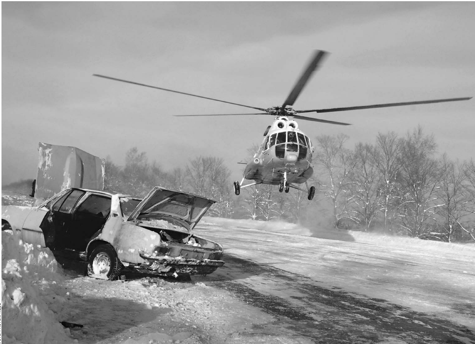
Дороги плохо проектируют, плохо строят, плохо чистят. Но это не главные причины аварий

На гладких трассах случается больше аварий, чем на ухабистых