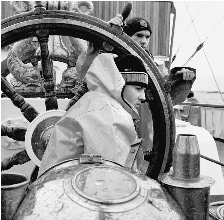
Курсанты учатся у старинного парусника мужеству и терпению

Один из самых знаменитых парусников мира отмечает юбилей в слегка «разобранном» состоянии. Барк «Седов» за свою 90-летнюю историю по словам капитана совершил более двадцати кругосветок и сейчас нуждается в ремонте. Самому большому паруснику традиционной постройки нужно подлатать кают-компанию, палубу, машинное отделение, корпус и днище. Вновь поднять паруса команда планирует уже в апреле ➔04