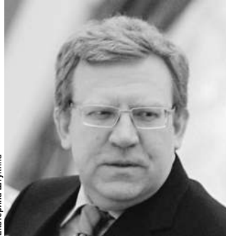
Алексей Кудрин не только экономит деньги, но и ищет их

Россия не стала первым государством, добившимся от швейцарцев согласия на раскрытие некоторых маленьких банковских тайн. В разгар кризиса 2008 года вопросом вывода денег из страны озаботились США. Они обвинили Швейцарию в потакании налоговым преступлениям и