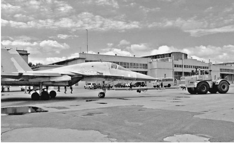
Фронтальной бомбардировщик нового поколения с большим трудом преодолевал путь в войска. И эта дорога еще далеко не окончена