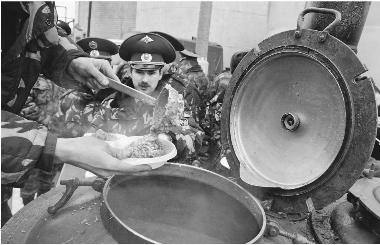
Потреблять «кирзу» способны только подготовленные кадры

Новые нормы питания не предусматривают традиционной каши