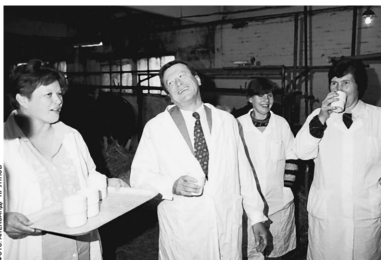
В 1999 году Виктор Зубков участвовал в предвыборной борьбе за пост губернатора Ленинградской области. На снимке — во время предвыборной поездки