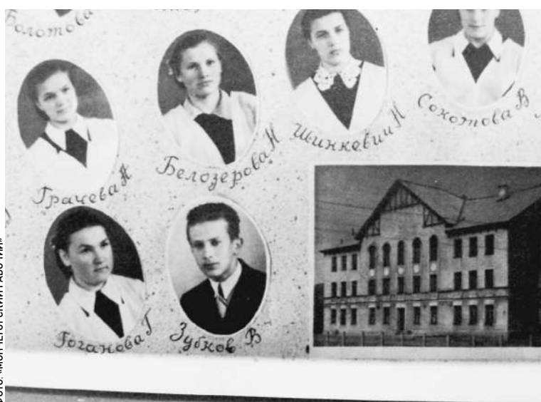
Учителя школы № 5 хранят фотографию класса, в котором учился будущий премьер

Нацпроектам на днях исполнилось два года. Президент Владимир Путин отметил это событие инспекционной поездкой по Чувашии и Белгородской области, по итогам которой проведет завтра в Белгороде заседание Совета по реализации приоритетных национальных проектов и демографической политике. В этом мероприятии, да и во всей поездке, компанию президенту составляли несколько членов