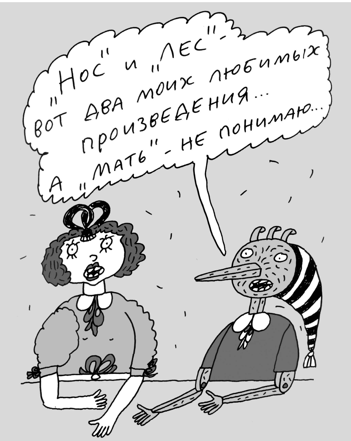
РИСУНОК АНДРЕЯ БИЛЬЖО

«Известия» и Российский союз ректоров возвращают школьникам литературу и историю