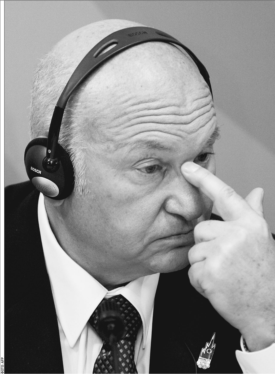
Мэр Москвы сгоряча отказался и от борьбы за Олимпиаду-2016

Вчерашнее заседание 117-й сессии Международного олимпийского комитета в Сингапуре закончилось вполне предсказуемым итогом. Право организовать Игры-2012 досталось Лондону, в финале одолевшему конкурентов из Парижа. Москва подтвердила самые черные прогнозы и выбыла из претендентской гонки уже в первом круге. Корреспондент «Известий» оказался единственным журналистом, который собственными глазами наблюдал за событиями в штабе российской столицы перед самым началом ее презентации. Владимир Раух Сингапур До выступления Москвы оста- ется ровно час. Мне удалось обмануть бдительность не- скольких постов охраны и проникнуть в святая святых «Свисс-отеля» — место, где расположены офисы всех пяти городов-кандидатов. Подхожу к боксу с каким-то гастроно- мическим названием «Буттер- вот», выделенному Заявочному комитету «Москва-2012». На- пряжение просачивается даже через закрытую полированную дверь. → стр. 3