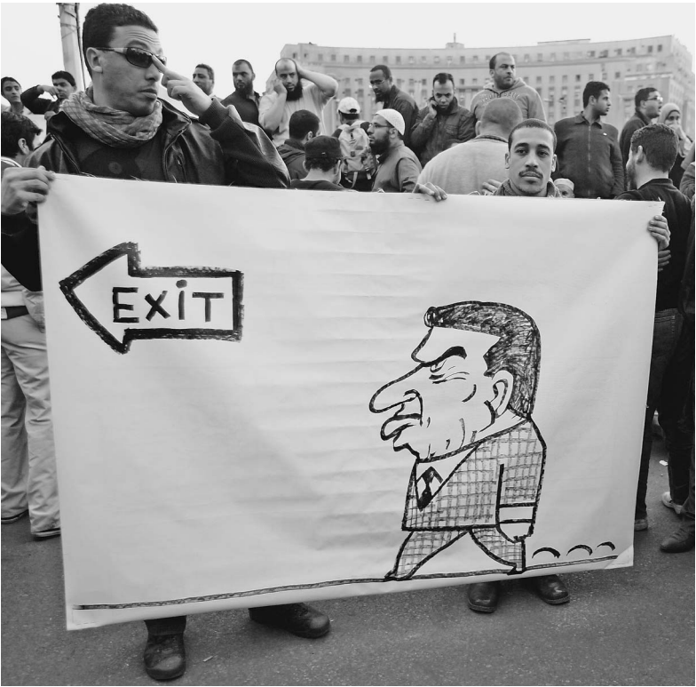
В «финиковой революции» наступил перелом. Либо Мубарак уступит требованиям улицы, либо в Египте начнется кровавый террор