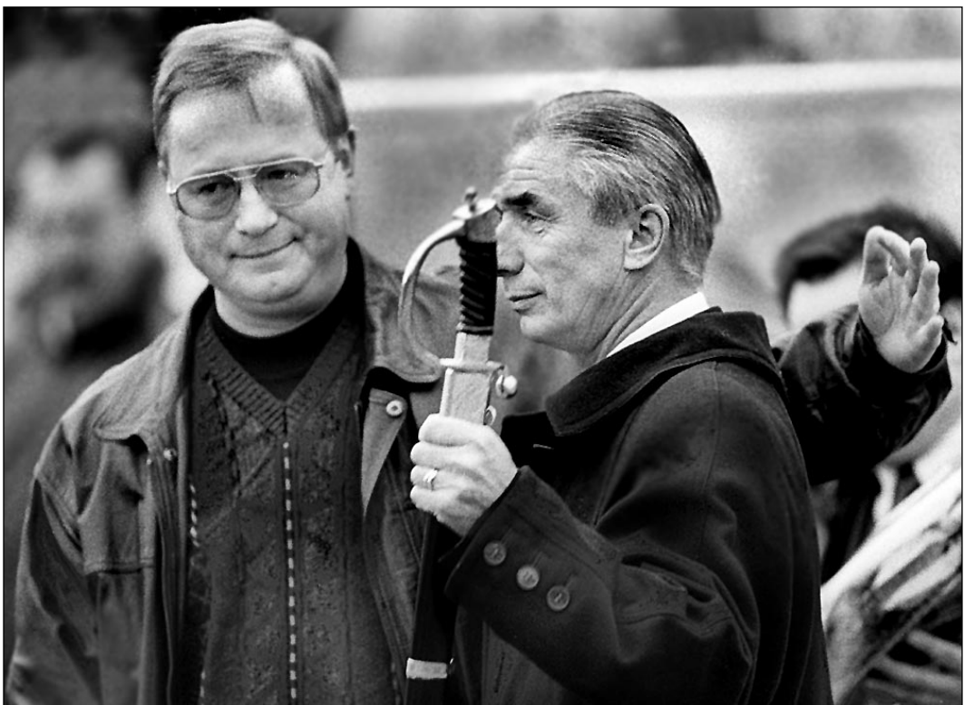
11 апреля 1999 года. Стадион «Динамо». Сергей СТЕПАШИН вручает главному тренеру московских динамовцев Георгию ЯРЦЕВУ (справа) подарок к дню рождения - памятную саблю.