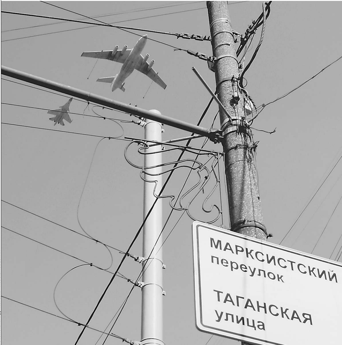
Вторник, центр столицы: дозаправщик и Су-34

Вчера Москва впервые смогла увидеть репетицию воздушной части Парада Победы 9 Мая на Красной площади. Около 11 часов по московскому времени над Тверской улицей, Манежной и Красной площадями прошла авиагруппа российских ВВС. Самолеты дальней авиации не летали над столицей с мая 1995 года — 50-летия Победы. Впервые во время пролета летчики продемонстрировали дозаправку самолета в воздухе — одно из самых сложных заданий для пилотов. Во время Парада Победы зрители смогут увидеть дозаправку на высоте всего 1,5 километра.