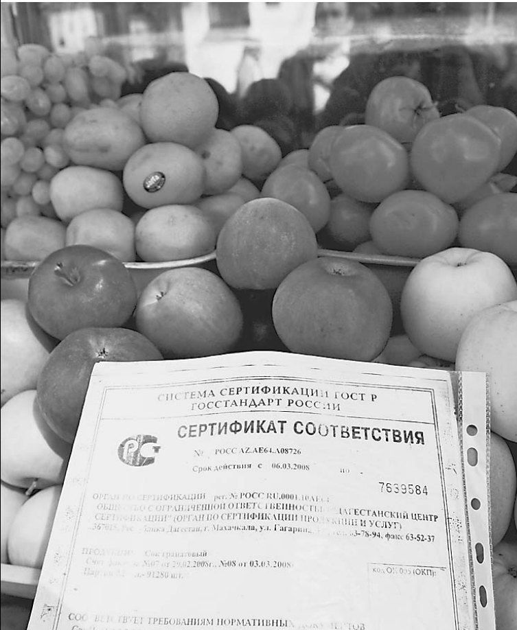
Размер и цвет значения не имеют. Выбирая продукты, требуйте сертификат соответствия

зирку» со всеми ее «прелестями» — недомоганием, тошнотой и, простите, сидением на унитазе, — заявил «Известиям» врач-саногеннолог НИИ питания РАМН Борис Качковский. — Избежать этого можно, надо лишь соблюдать простое правило: «покупай, но проверяй». → стр. 4