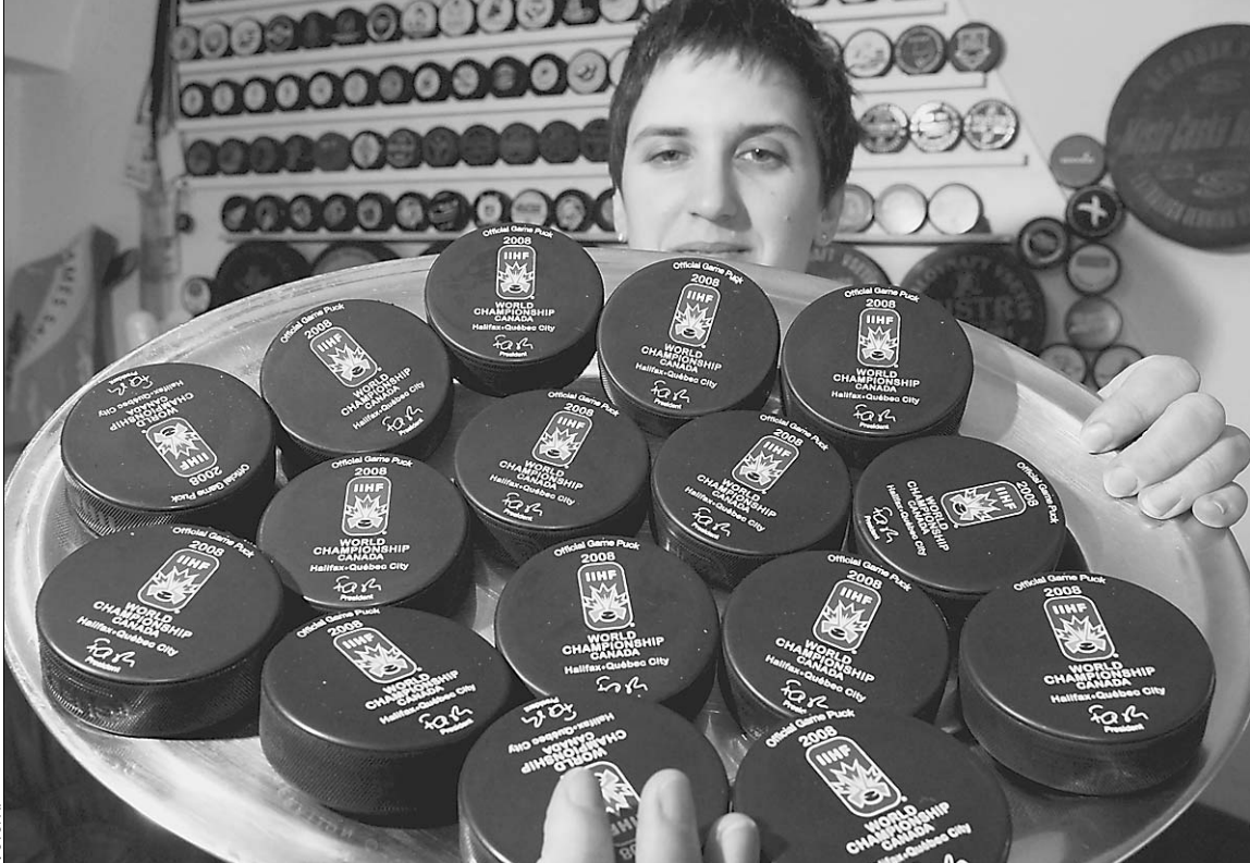
Недостатка в шайбах на родине хоккея не будет

2 мая в Канаде стартует хоккейный чемпионат мира, и 16 сильнейших команд планеты пустятся в двухнедельный марафон, почти не имея права на ошибку. Впервые за всю вековую историю Международной федерации хоккея (ИИХФ) первенство пройдет в стране, не просто подарившей миру этот вид спорта, но и трепетно пестующей свое детище. Прикоснуться к уникальному действу спешат лучшие хоккеисты мира, наплевав на то, что позади у них изнурительный сезон. → стр. 15