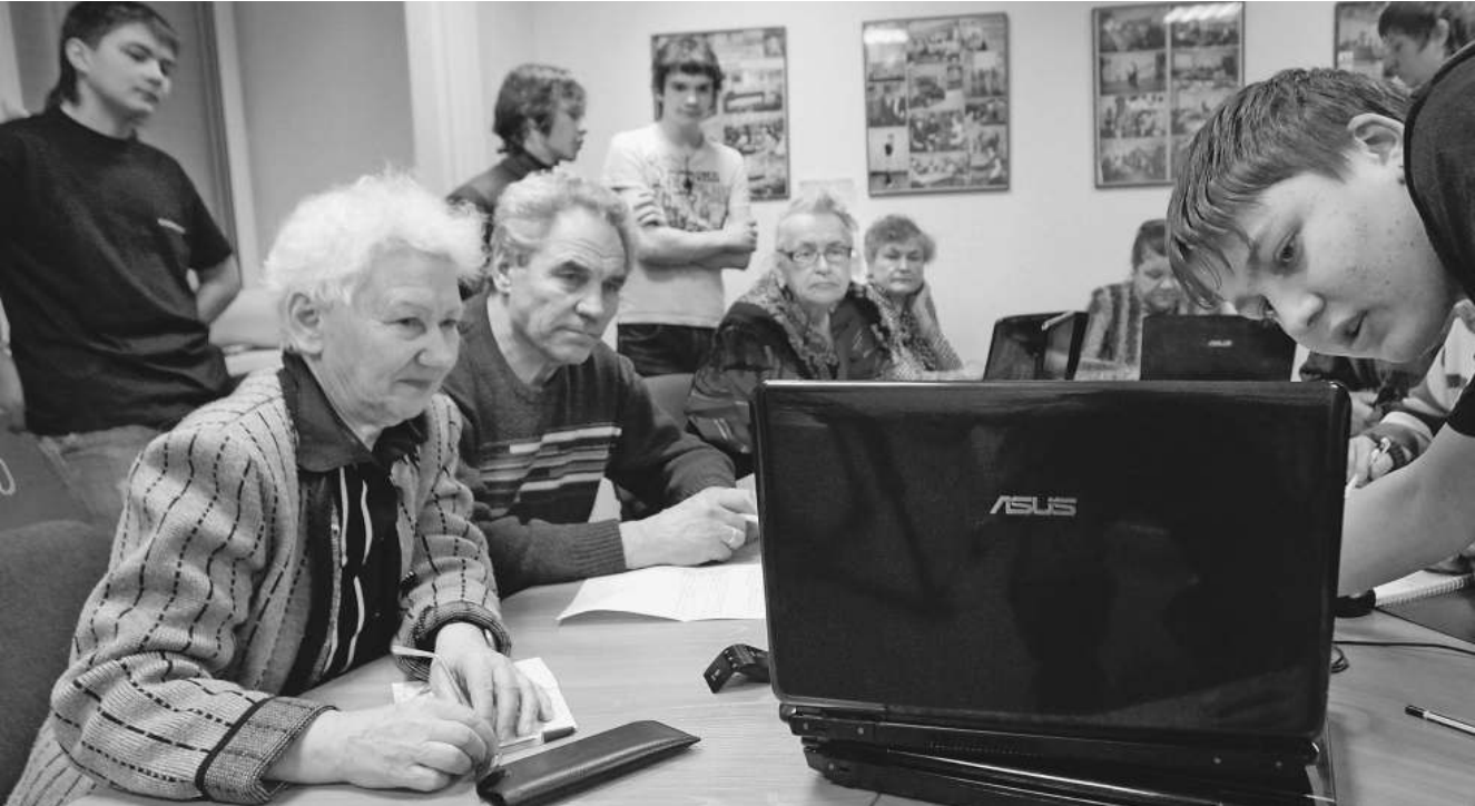
Постигать тонкости жизни в интернете пенсионерам приходится под руководством внуков. Но новому учиться никогда не зазорно