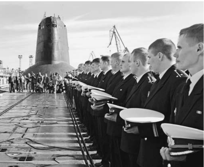
Боевое дежурство суперракетоносцев оказалось недолгим

Военные объясняют, что карьеру «Тайфунов» испортили «Бореи» — новые подлодки, которые строят на «Севмаше» под ракеты «Булава». Их успешные испытания сделали бессмыс-