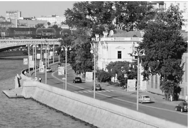
Грандиозный проект на набережной превратился в долгострой

В «Ирколе» комментировать конфликт отказались. По дан-