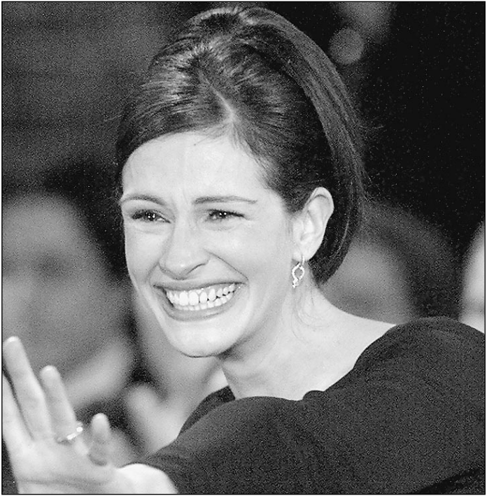
Неполная обнаженность Джулия Робертс снялась в дешевом кино