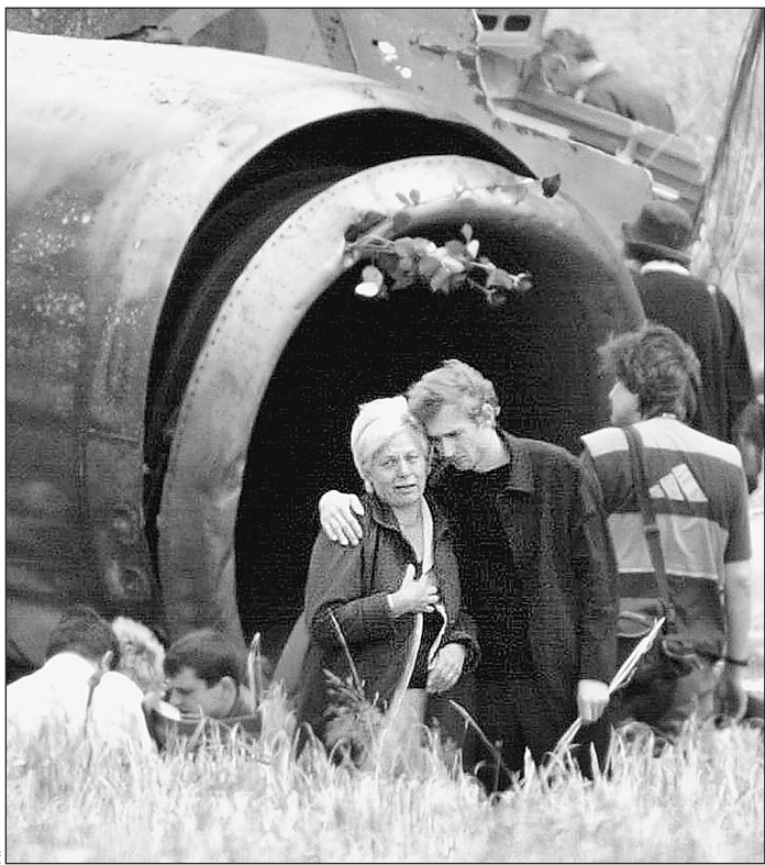
Родственники жертв катастрофы Ту-154 на месте падения самолета

Последние 50 секунд из жизни пилотов Ту-154 «Башкирских авиалиний»