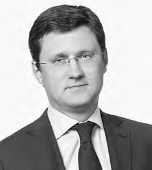
Александр Новак, министр энергетики РФ:

— Минэнерго предусмотрело консервативный и оптимистический сценарии развития угольной промышленности страны. Консервативный предусматривает рост добычи с 440 до 485 миллионов тонн, оптимистический — до 668 миллионов и соответствует генеральной схеме размещения объектов электроэнергетики на период до 2035 года, а также прогнозируемой конъюнктуре цен. Такой уровень добычи обеспечен крупными разведанными запасами в размере 196 миллиардов тонн. Ежегодно предполагается пополнять запасы дефицитных марок угля в среднем на 500 миллионов тонн.