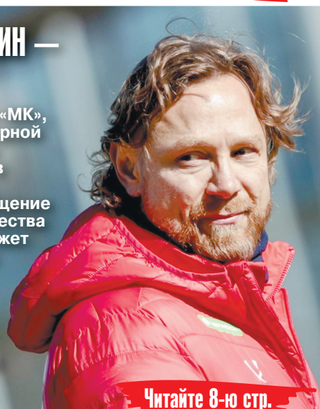
Читайте 8-ю стр.

Как стало известно «МК», главный тренер сборной России приступит к работе в «Динамо» в ближайшее время. Официальное сообщение о начале сотрудничества Карпина и клуба может быть опубликовано после того, как национальная команда под его руководством в начале июня сыграет с Нигерией и Белоруссией.