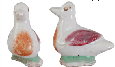
Набор мастерицы XVII века обнаружили археологи в Замоскворечье. Среди находок — записки, наперсток, пуговицы и др. Коллекцию отреставрируют и передадут в музей.

Как узнал «МК», коллекция предметов женского рукоделия обнаружили во время работ на Большой Татарской улице. Предположительно, аксессуары могли принадлежать горожанкам-ремесницам. Специалисты отмечают, что из находок хорошо сохранились записки с малевой вставкой, наперсток и подвесные пуговицы, выполненные из цветного металла. Подобные пуговицы были непременным атрибутом городского костюма горожан. Из украшений были обнаружены девичье колечко, а также разнообразные декоративные фигурные накладки для аксессуаров. Реставраторы уже успели провести необходимые работы по консервации предметов. Археологические работы в Замоскворечье проводили на нескольких раскопах, в результате были получены ценные исторические данные по освоению этого района. Сформированная по итогам исследований коллекция включает 1203 артефакта. Это предметы городского быта XVI—XVII веков, а также XVIII—XIX столетий. К более позднему периоду