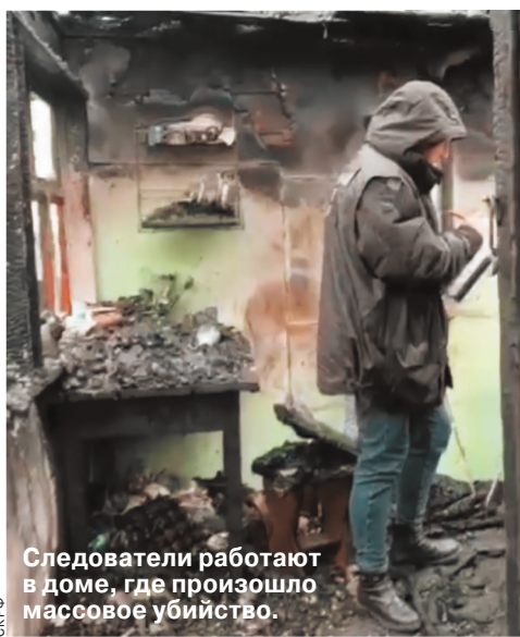
Следователи работают в доме, где произошло массовое убийство.