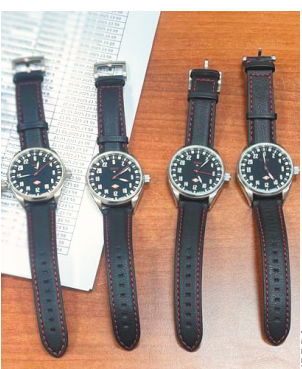
его словам, все же вернул коварные дары «данайцу двадцати первого века». Но на этом история не закончилась.