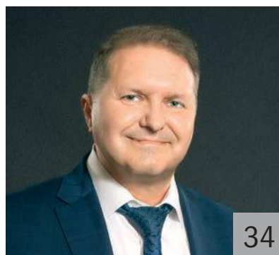
А. С. СТАРКОВ, министр финансов Свердловской области