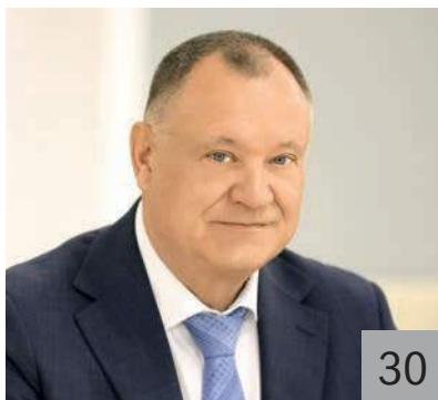
В. М. ЩЕГЛЕВАТЫХ, заместитель губернатора Липецкой области — начальник Управления финансов