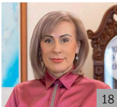
О. Н. ЛОПАТИНА, министр финансов Сахалинской области