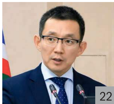
И. И. АЛЕКСЕЕВ, и. о. министра финансов Республики Саха (Якутия)