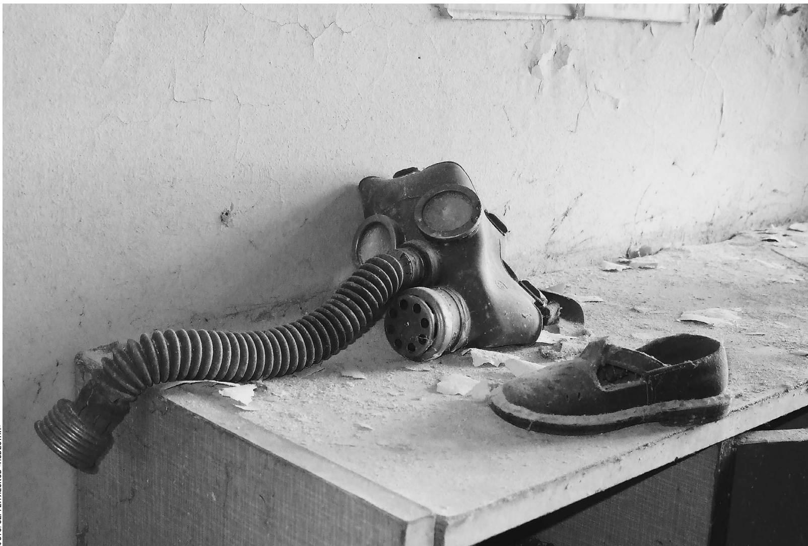
В детском саду мертвого города Припять

Наш обозреватель рассказывает, что происходит на Чернобыльской АЭС через 25 лет после взрыва