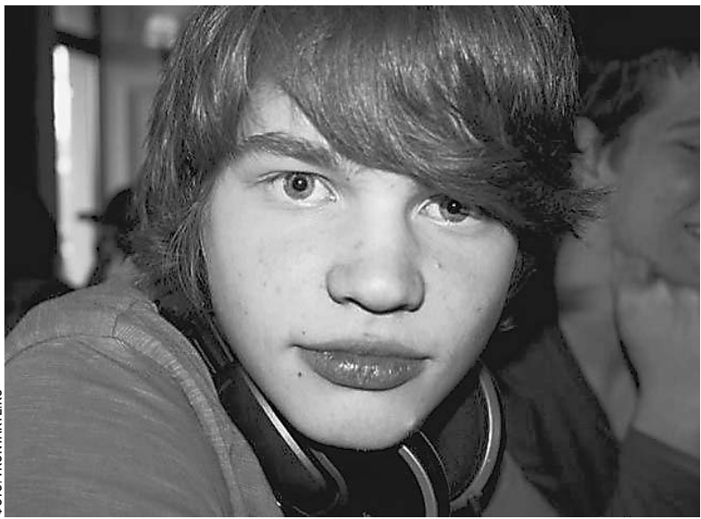
Для Ивана КАСПЕРСКОГО произошедшее стало потрясением