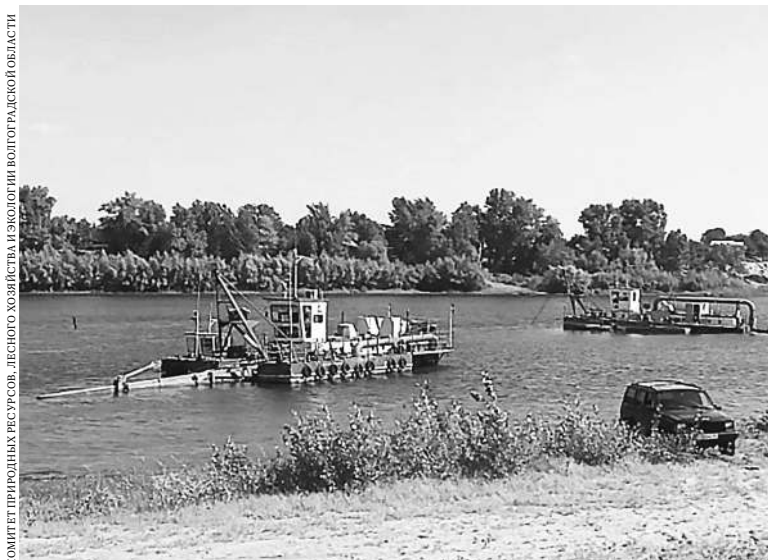
КОМИТЕТ ПРИРОДНЫХ РЕСУРСОВ, ЛЕСНОГО ХОЗЯЙСТВА И ЭКОЛОГИИ ВОЛГОГРАДСКОЙ ОБЛАСТИ

За шесть лет в Волго-Ахтубинской пойме очистят от ила и наносов 42 водоема.